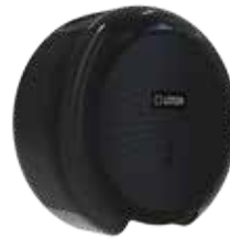
REF: CP-3006-BL Acabado NEGRO