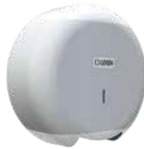
REF: CP-3006-B Acabado BLANCO